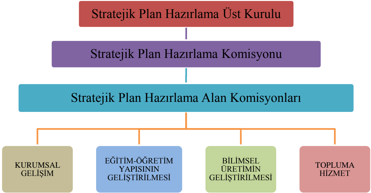
Şekil 1. Stratejik Planlama Çalışmaları Organizasyonu ve Katılımcıları