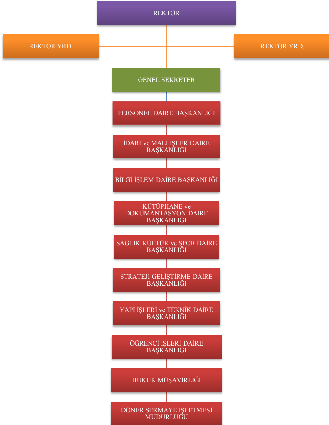
Şekil 3.İdari Birimler Teşkilat Yapısı